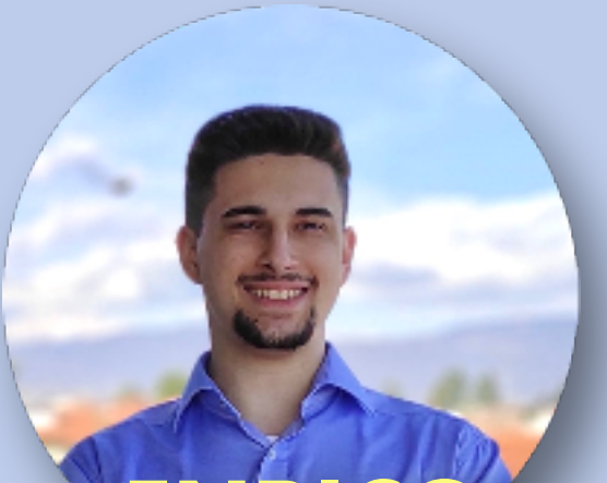
ENRICO DEL PIERO