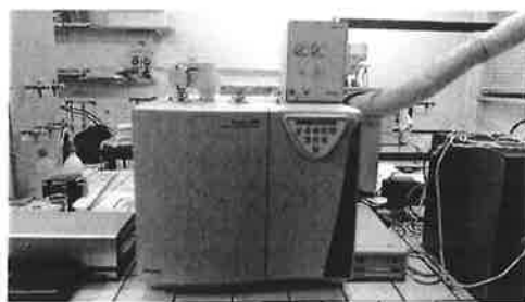
Flash 2000 Thermo Scientific Analyzer